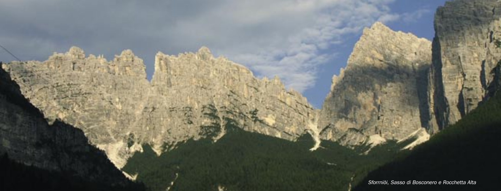
Sforziò, Sasso di Bosconero e Rocchetta Alta

Seguendo la strada in asfalto si giunge alla Forcella Ciandolà, 1565 m, poi, sempre sulla strada che ora va a sud sul sentiero n. 456, si giunge al vicino Rifugio "Gianpietro Talamini", 1582 m.