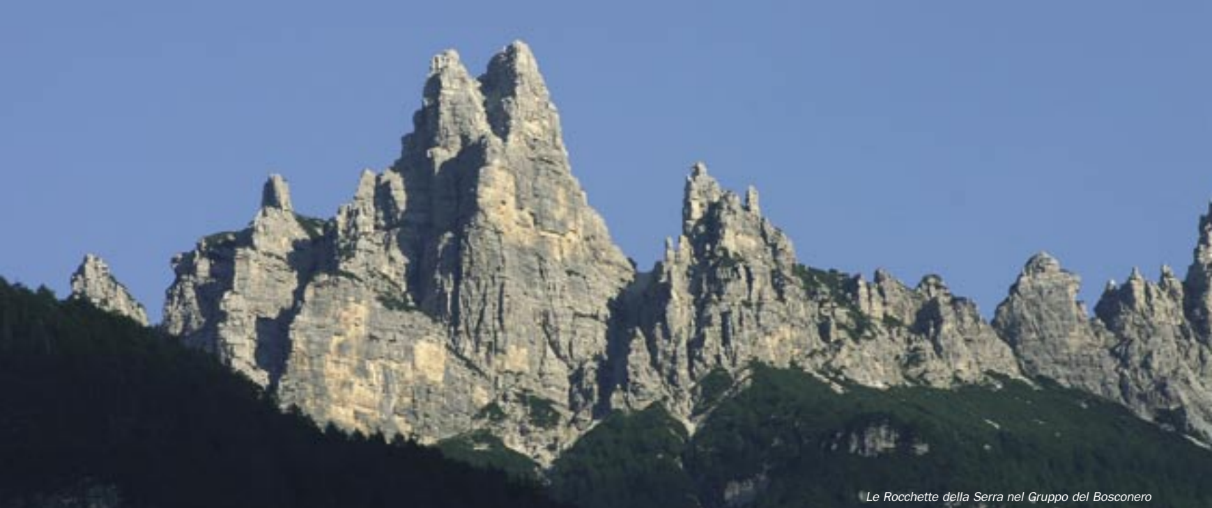
Le Rocchette della Serra nel Gruppo del Bosconero

Presso il Museo c'è il Rifugio Dolomites di proprietà privata, aperto da fine maggio alle prime nevi con servizio di alberghetto e 26 posti letto con lenzuola e piumini; cucina tipica; servizi con acqua calda; bagno in tutte le camere; riscaldamento; Soccorso del CNSAS "118"; telefono rifugio +39 0435 3 13 15. Email: info@rifugiadolomites.it - www.rifugiadolomites.it