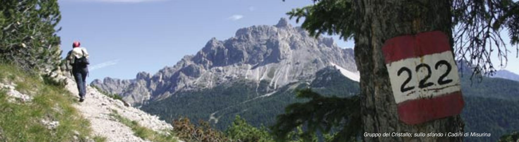
Gruppo del Cristallo; sullo sfondo i Cadini di Misurina

est, in moderata discesa, le pendici nord del Monte Specie, quindi, con qualche passaggio esposto, ma agevolato da corde metalliche e ponticelli di legno, si giunge a una galleria di guerra. Oltre questa il sentiero scende diagonalmente, zigzagando fra i mughi, con suggestive vedute sul Gruppo dei Róndoi-Barànci, sulle Tre Cime di Lavaredo e sul Monte Piana. Quindi il sentiero, ormai in basso, traversa verso sud raccordandosi alla Statale 51 d'Alemagna presso l'Hotel Cime di Lavaredo-Hotel Drei Zinnenblick, 1406 m, che sorge allo sbocco della Val Rinbón-Schwarzeriental, nel punto in cui le Tre Cime di Lavaredo si vedono sveltare superbe sopra l'aspro solco della valle come in un quadro di Compton.