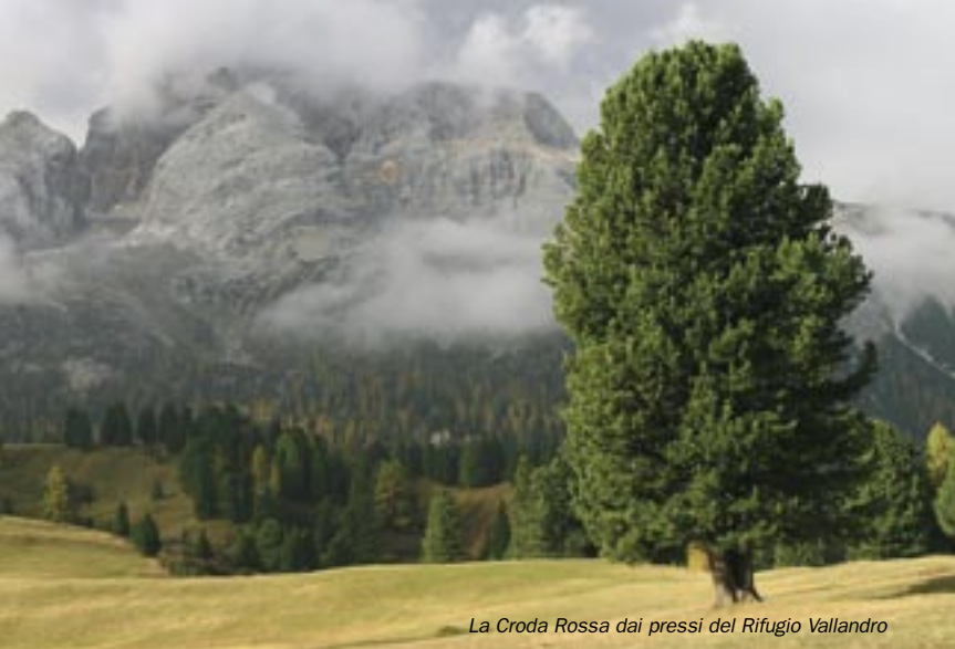
La Croda Rossa dai pressi del Rifugio Vallandro

ovest, lo si segue e si sale sotto le rocce del Sèrla per terreno dirupato fino a toccare la panoramissima Forcella Sèrla-Sarlsattel, 2229 m, situata fra il Monte Sèrla-Sarlkofel e il Monte Lungo-Lungkofel