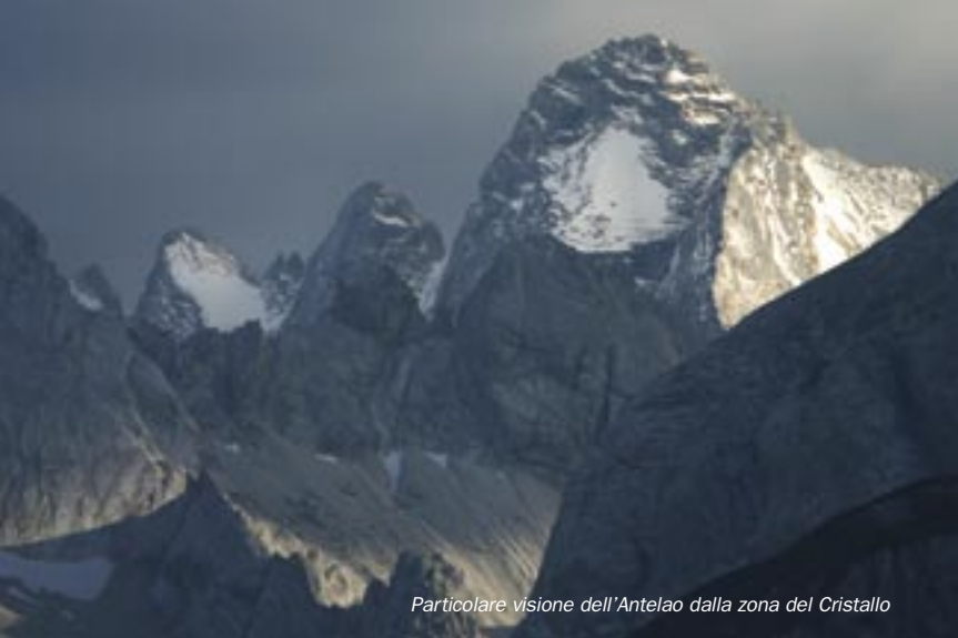
Particolare visione dell'Antelao dalla zona del Cristallo

Quindi si entra nell'impluvio del Rio Rudavò che si segue fino a scendere a quota 1710 m circa sulla Statale 48 che proviene da Misurina ed è diretta al Passo Tre Croci.