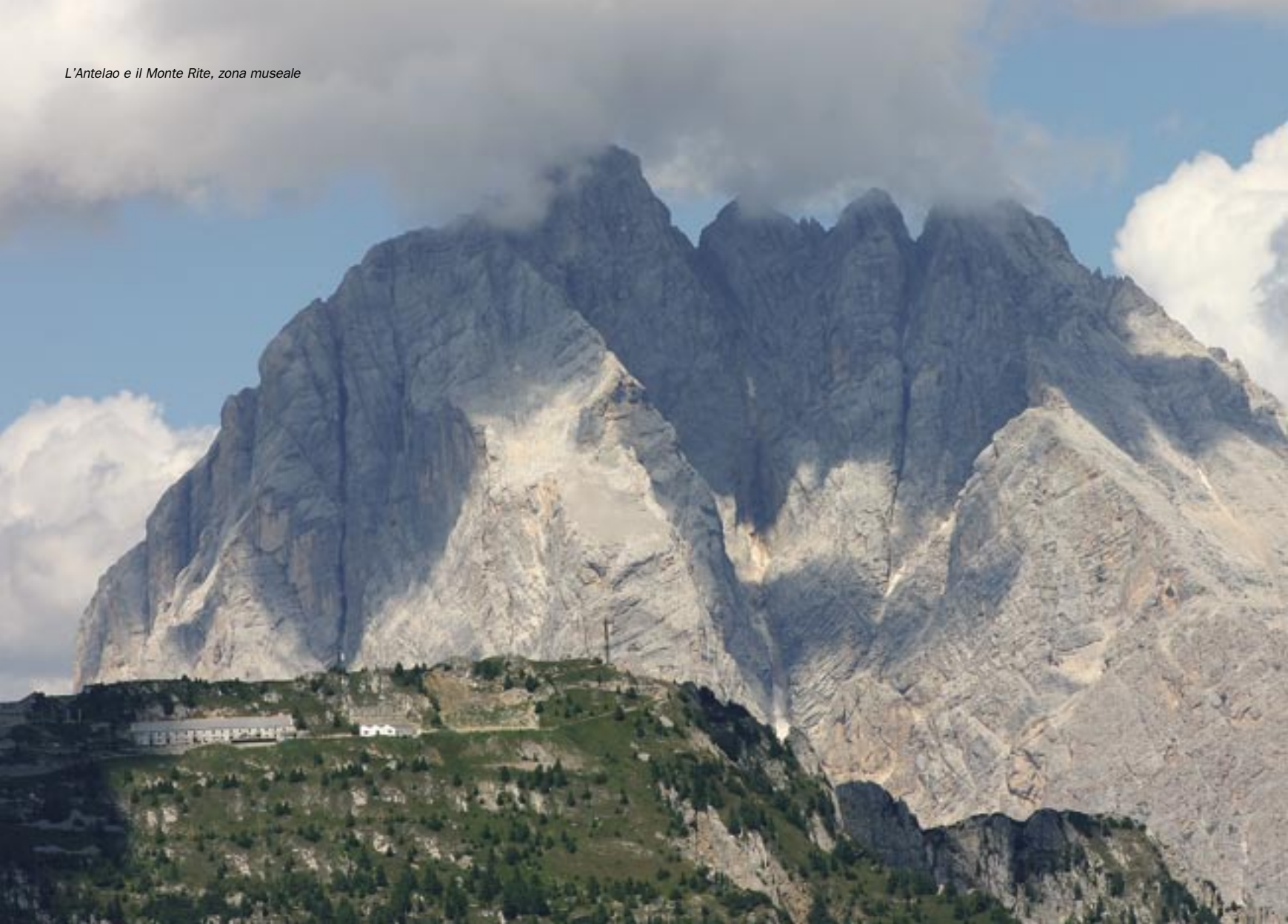
L'Antelao e il Monte Rite, zona museale