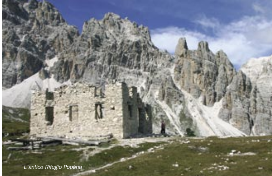
L'antico Rifugio Popéna

Dalla Val di Landro, cioè dall'Hotel Cime di Lavaredo o da