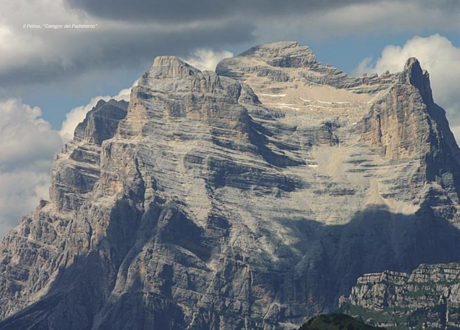
Il Pelmo, "Caregon del Padreterno"